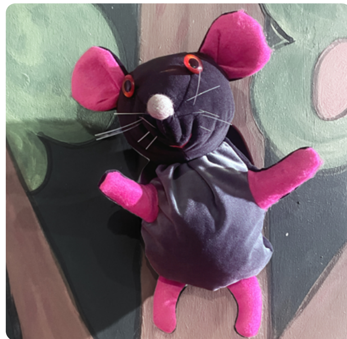
RATTUS DANS LE SPECTACLE