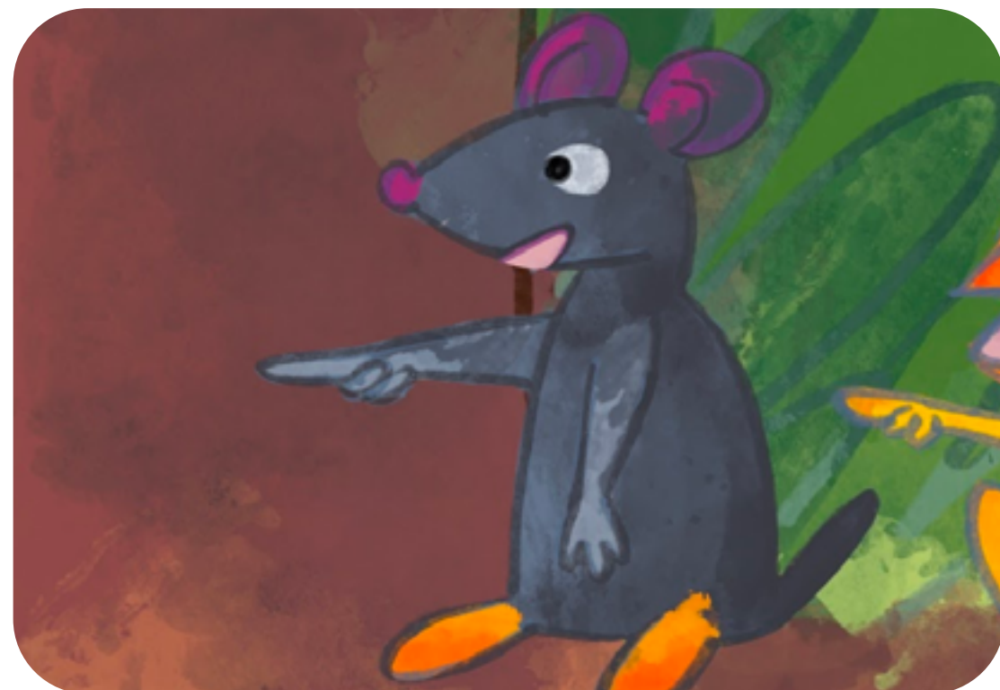
RATTUS DANS LE LIVRE

Le rattus est aussi appelé "le rat noir", même si il s'est propagé un peu partout dans le monde, il est originaire du sud-est asiatique. Il vit en groupe et obéit à un chef (le mâle dominant). Il construit sa maison en haut des arbres contrairement aux autres rats qui préfèrent vivre en bas ou dans le sous-sol. Il est très craintif et a peur de tout, ce qui le rend très prudent.