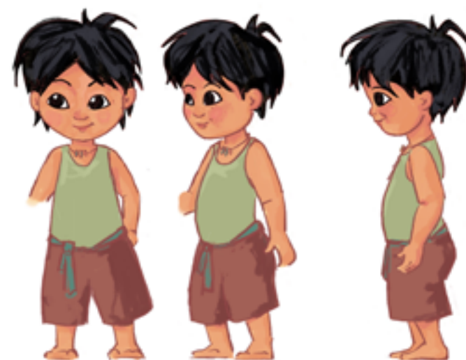
KIM DANS LE LIVRE