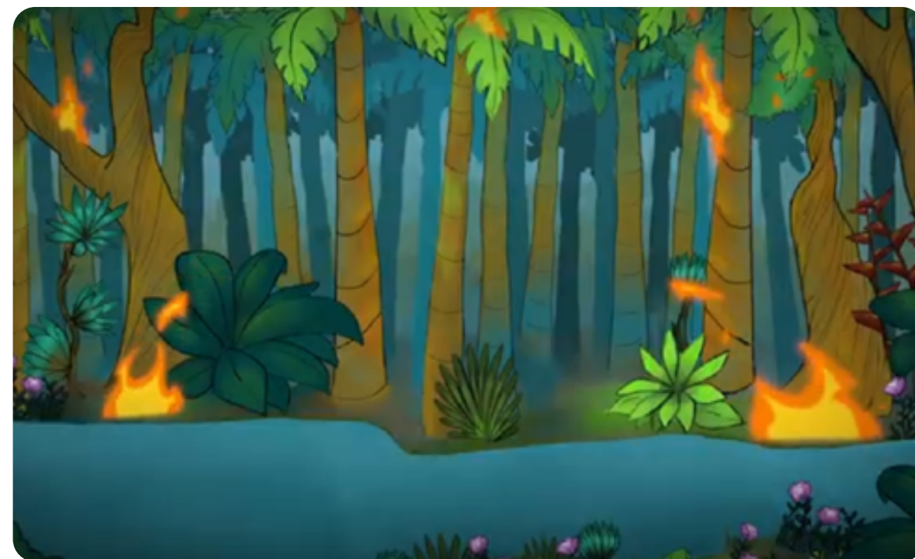
LA FORÊT DANS LE SPECTACLE