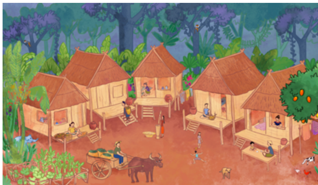
LES MAISONS DANS LE LIVRE

Les maisons sur pilotis sont les maisons traditionnelles au Laos. Elles sont maintenues en hauteur posées sur des bouts de bois. C'est principalement pour se protéger de la mousson, sinon elles seraient inondées chaque année. Elles ont de larges fenêtres sans vitres et une grande ouverture pour l'entrée. C'est pour faire passer l'air pendant la saison sèche où il fait très chaud. Elles ont aussi une grande terrasse, car les Laotiens aiment bien être dehors et c'est plus facile pour accueillir les amis. Ces maisons sont construites avec les arbres et les feuilles de la forêt pour être en harmonie avec la nature.