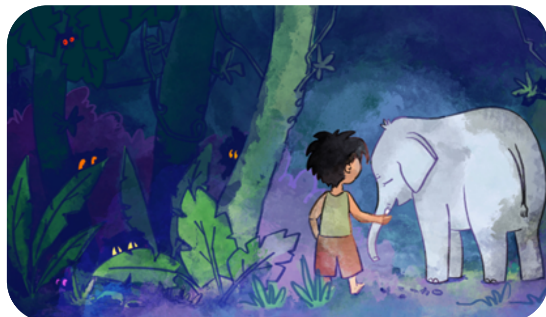
LA FORÊT DANS LE LIVRE

La forêt primaire est une forêt ancienne. c'est-à-dire que les hommes ne l'ont pas encore exploitée ou transformée. Elle est restée telle qu'elle est apparue, il y a des millions d'années bien avant les hommes préhistoriques. Elle est composée de milliers d'arbres et de plantes différents, serrés les uns contre les autres, on n'y voit pas très bien. Dans cette forêt vivent de nombreux animaux qu'on appelle "animaux sauvages".