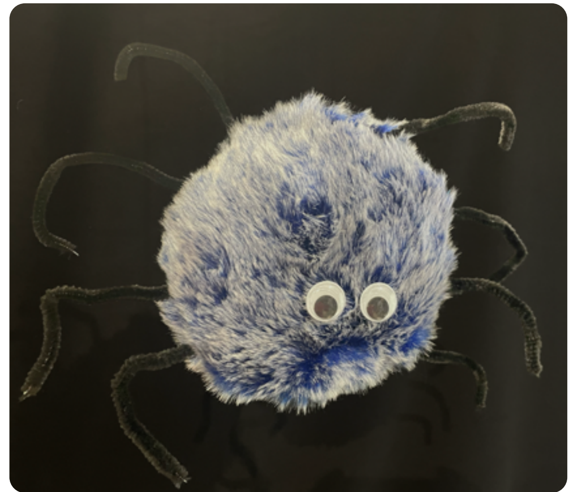
L'ARAIGNÉE DANS LE SPECTACLE