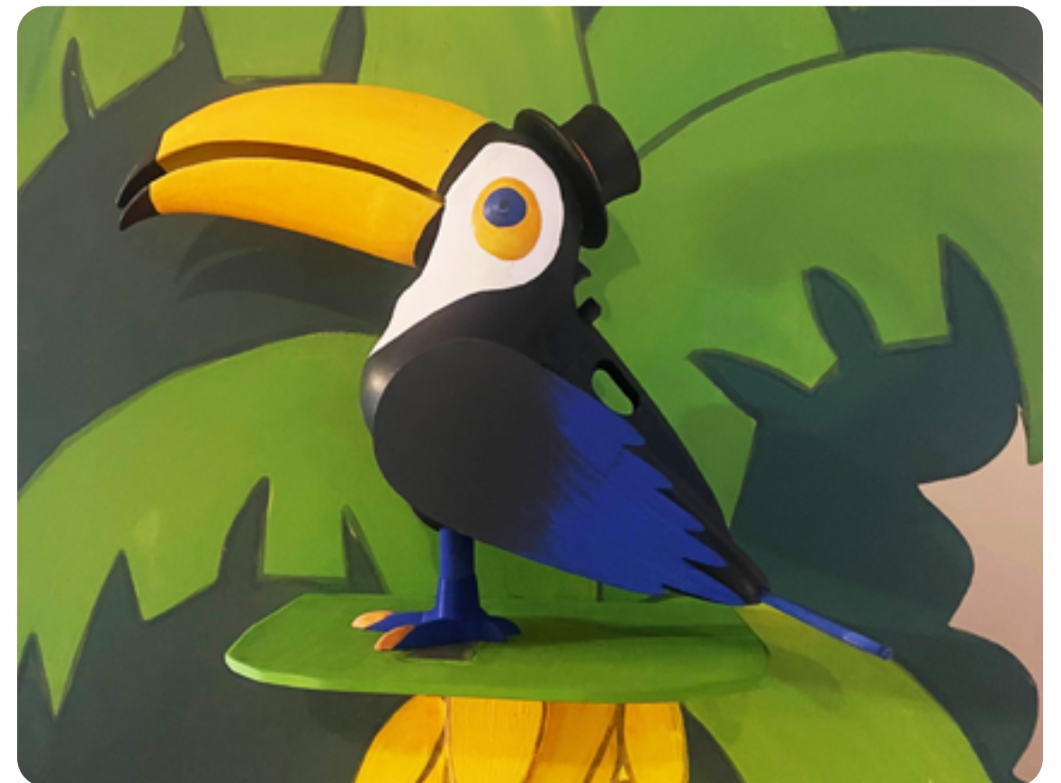
MONSIEUR TOUCAN DANS LE SPECTACLE