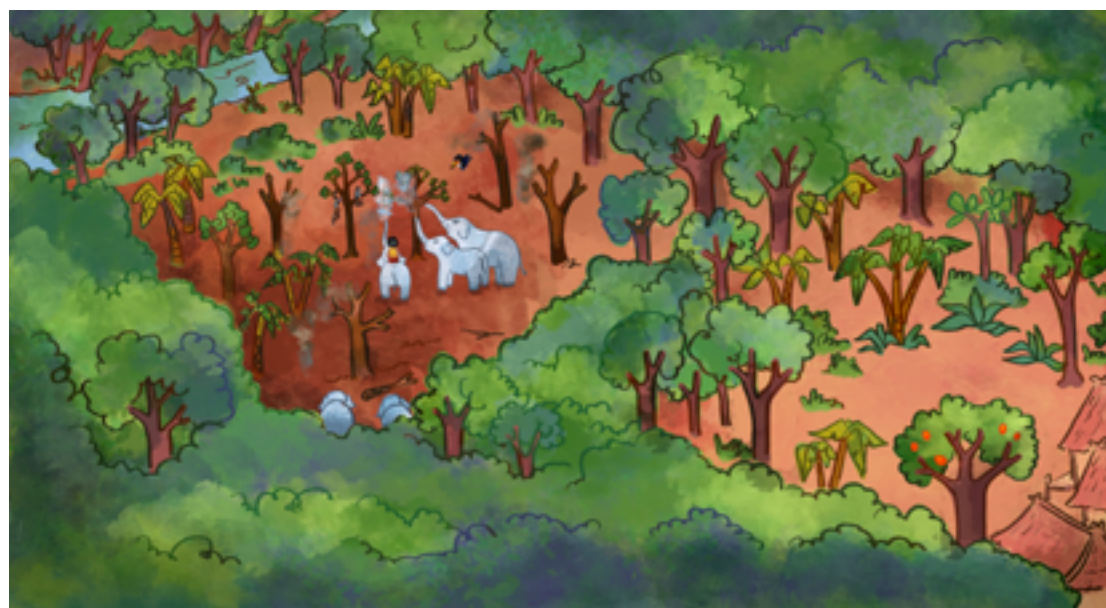
LA FORÊT DANS LE LIVRE

A notre époque, les êtres humains sont de plus en plus nombreux. Alors pour construire de nouvelles routes, de nouvelles maisons et pour agrandir les champs afin de nous nourrir, nous brûlons exprès la forêt. Pourtant dans la forêt vivent de nombreux animaux sauvages qui perdent leur maison. Si nous ne changeons rien, beaucoup de ces animaux vont disparaître. De plus, c'est grâce aux forêts et aux arbres que nous respirons de l'air bon. Il est important de protéger les forêts.