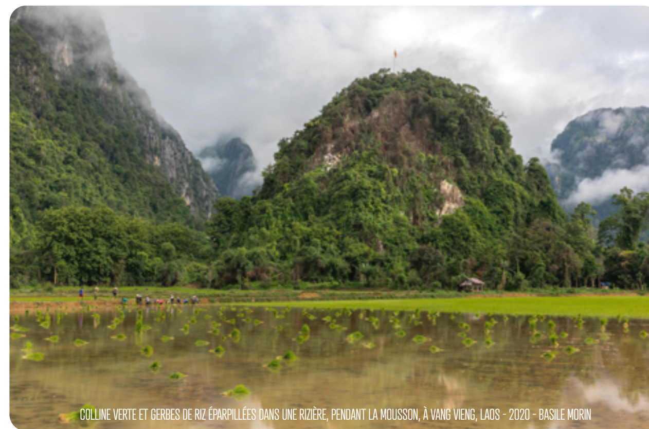
COLLINE VERTE ET GERBES DE RIZ ÉPARPILLÉES DANS UNE RIZIÈRE, PENDANT LA MOUSSON, À VANG VIENG, LAOS - 2020 - BASILE MORIN