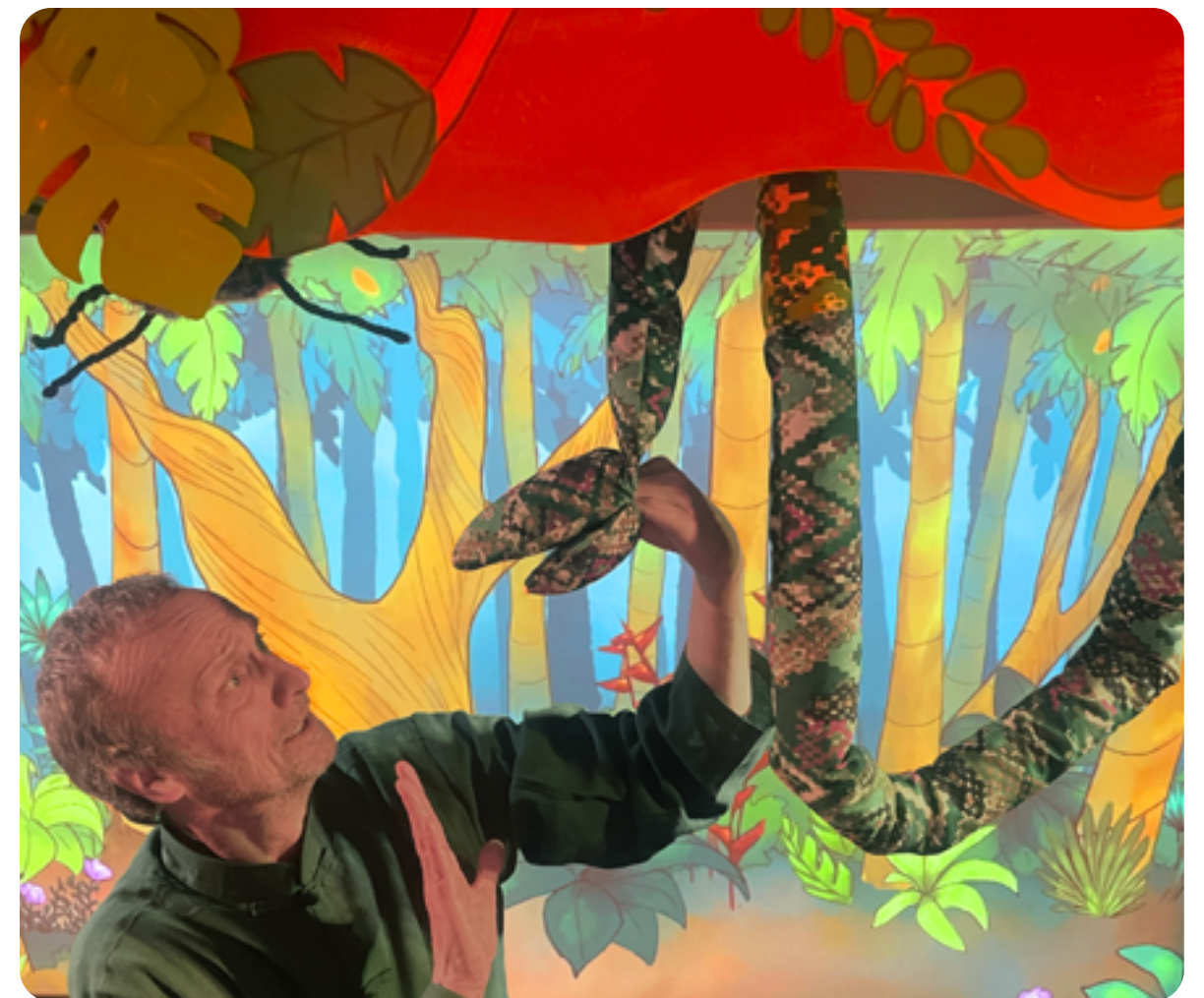
LE SERPENT DANS LE SPECTACLE