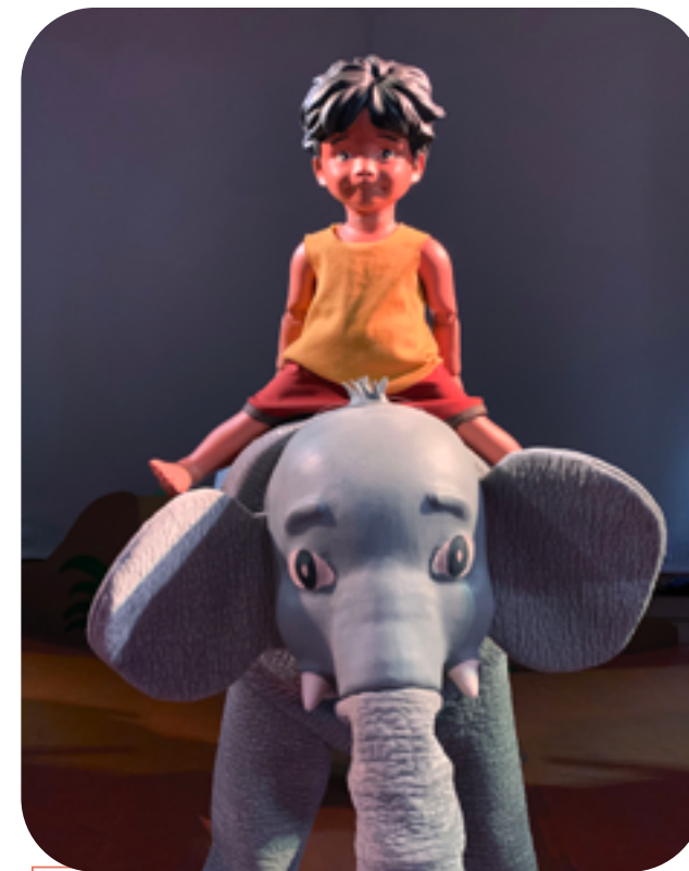
PHOTO DU SPECTACLE

Au Laos on dit que l'éléphant est la clé de voûte de la forêt primaire. Sans lui, la forêt disparaîtrait. Il mange près de quatre cents kilos de végétaux par jour et il fait caca très souvent et dans son caca il y a plein de graines qui vont devenir des plantes et des arbres. Dans son passage, il écrase tout mais il fait entrer la lumière dans la jungle très sombre et les petites plantes grâce à la lumière prennent de la force. A chaque pas, il laisse un trou qui devient une petite mare où les insectes déposent leurs œufs qui deviendront des larves puis de futurs insectes. On dit que l'éléphant est le jardinier discret de la forêt.