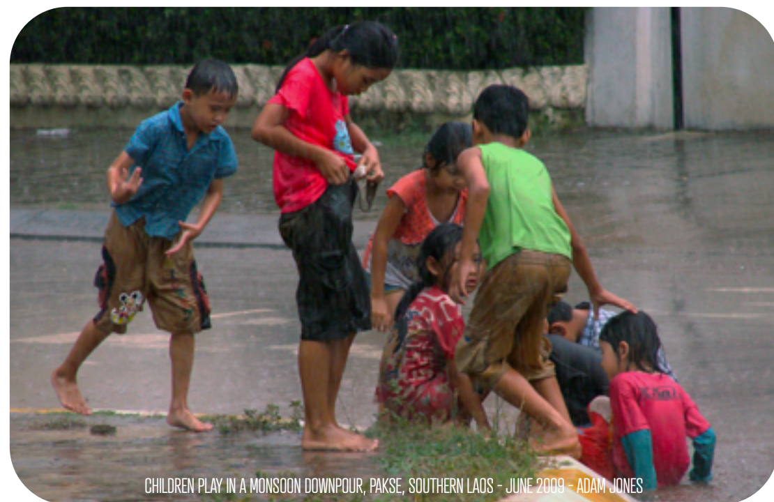
CHILDREN PLAY IN A MONSOON DOWNPOUR, PAKSE, SOUTHERN LAOS - JUNE 2009

La mousson est un phénomène qui se trouve dans les régions tropicales. Ce sont des vents venant de la mer vers les terres qui s'accompagnent de pluies abondantes pendant l'été. Ces pluies entraînent de fortes chaleurs surtout pendant les mois d'avril et de mai. Il fait très chaud et c'est très humide. Puis il y a la mousson d'hiver qui va de la terre vers la mer. Il fait chaud et sec.