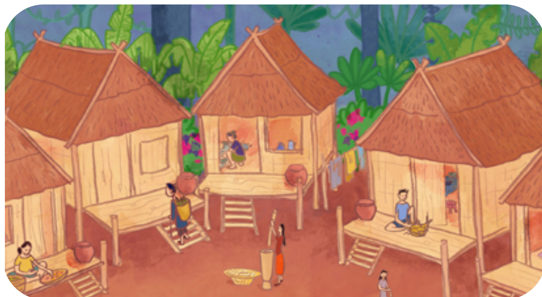
LE VILLAGE DANS LE LIVRE

Les maisons sur pilotis sont les maisons traditionnelles au Laos. Elles sont maintenues en hauteur posées sur des bouts de bois. C'est principalement pour se protéger de la mousson, sinon elles seraient inondées chaque année. Elles ont de larges fenêtres sans vitres et une grande ouverture pour l'entrée. C'est pour faire passer l'air pendant la saison sèche où il fait très chaud. Elles ont aussi une grande terrasse, car les Laotiens aiment bien être dehors et c'est plus facile pour accueillir les amis. Ces maisons sont construites avec les arbres et les feuilles de la forêt pour être en harmonie avec la nature.