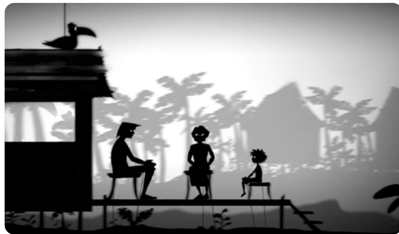
UNE MAISON DANS LE SPECTACLE