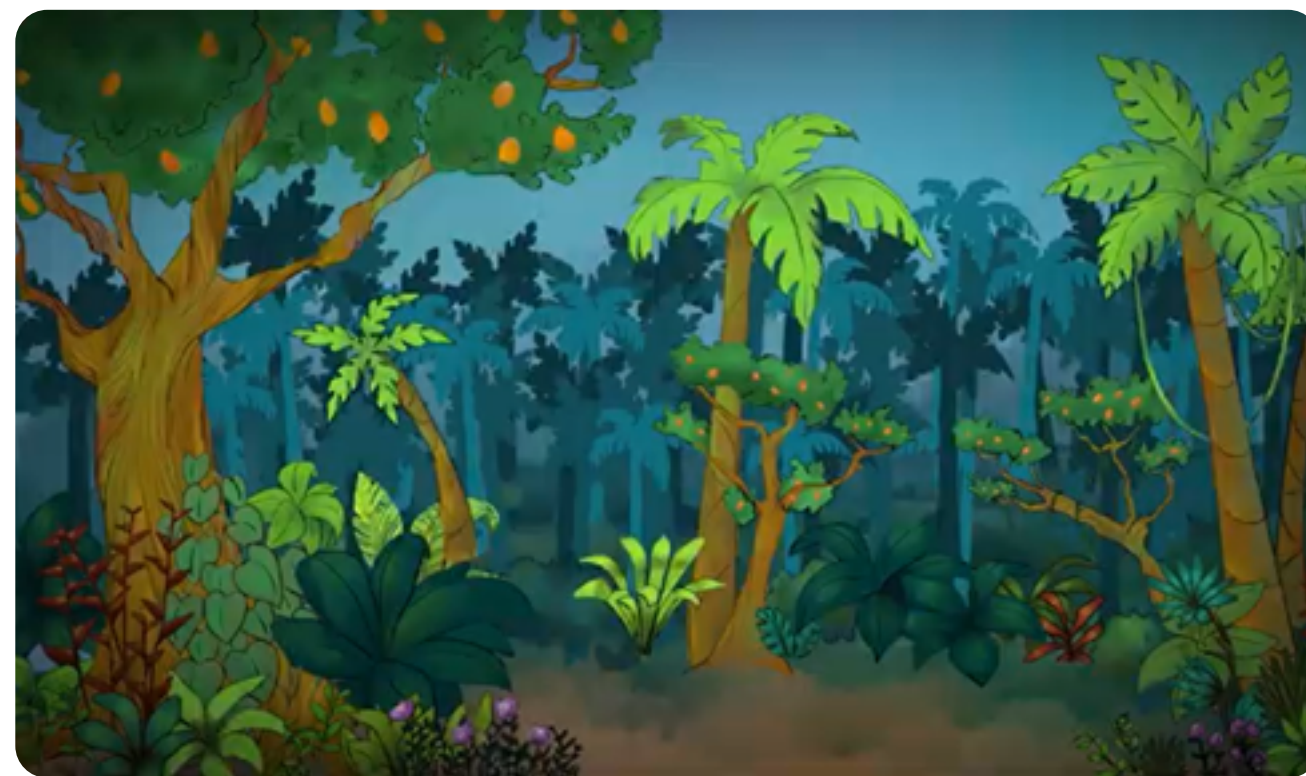
LA FORÊT DANS LE SPECTACLE