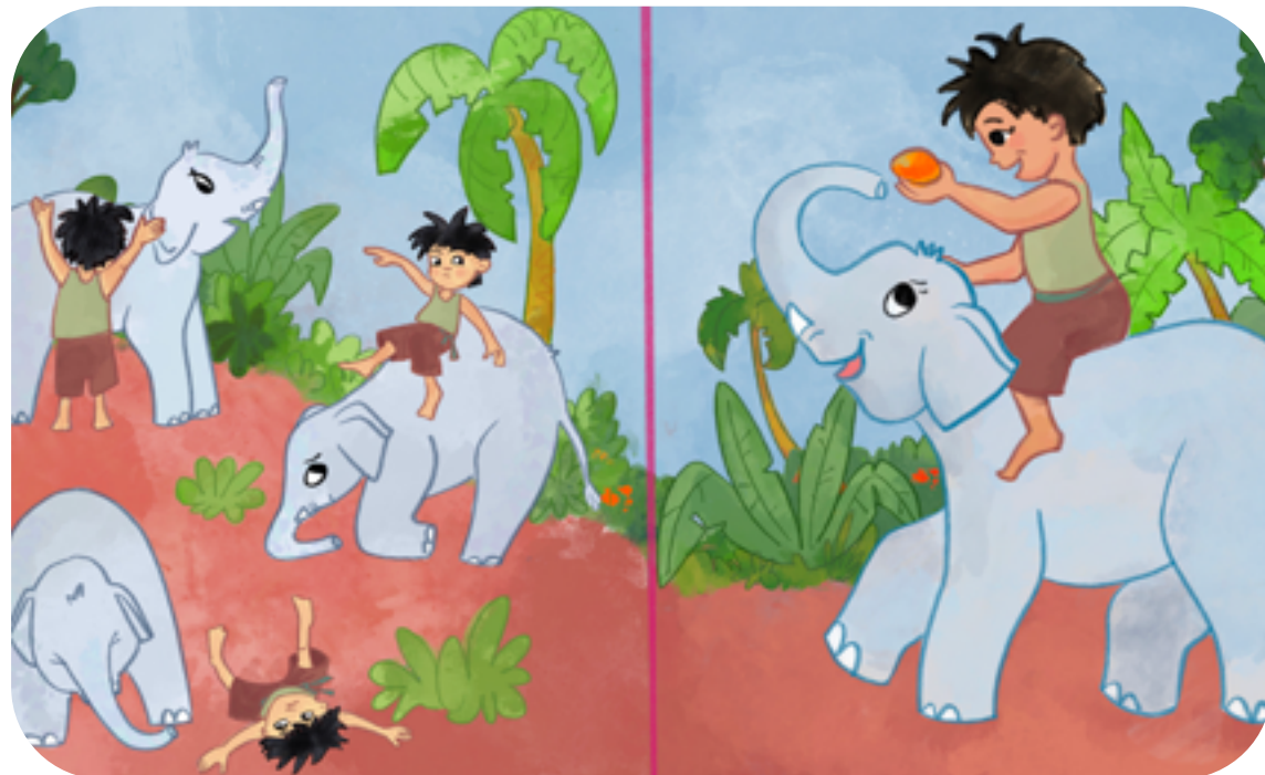
VAVAH DANS LE LIVRE

Vavah est un éléphant d'Asie. Il est plus petit que son cousin d'Afrique. Mais la grosse différence et ce qui nous permet de les reconnaître est la taille des oreilles. L'éléphant d'Asie a de toutes petites oreilles. En Asie les hommes se sont servis des éléphants pour les gros travaux; transporter des troncs d'arbres, porter des objets très lourds ou des gens. C'est pourquoi on trouve des cornacs seulement en Asie, pas en Afrique car les éléphants sont restés sauvages. La devise du Laos est " Le pays du million d'éléphants ", mais maintenant, il ne resterait que 400 éléphants sauvages dans la jungle laotienne; Il est en danger.