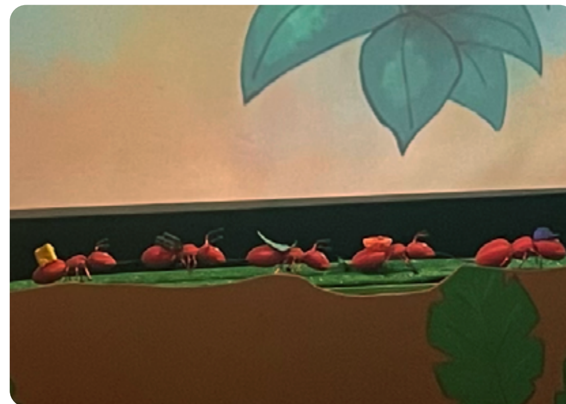
PHOTO DU SPECTACLE